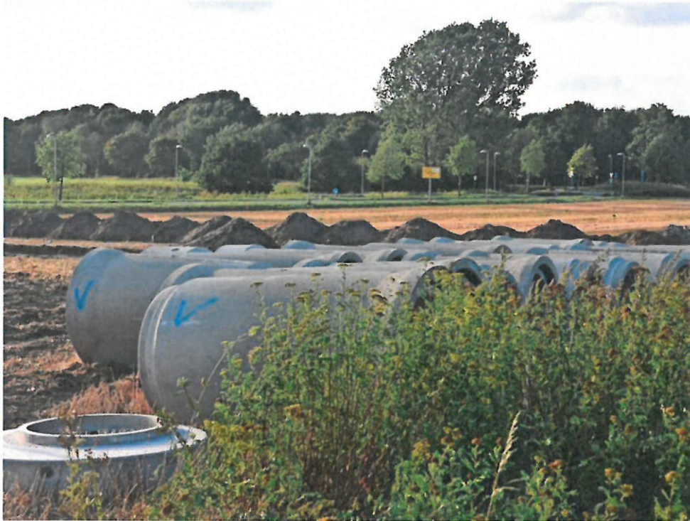
Die Erschließung des neuen Wohnquartiers zwischen Europaallee und Meyenfelder Straße hat begonnen.