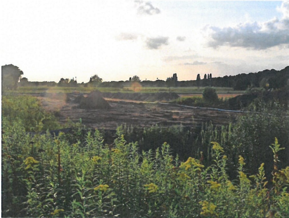
Die Erschließung des neuen Wohnquartiers zwischen Europaallee und Meyenfelder Straße hat begonnen.