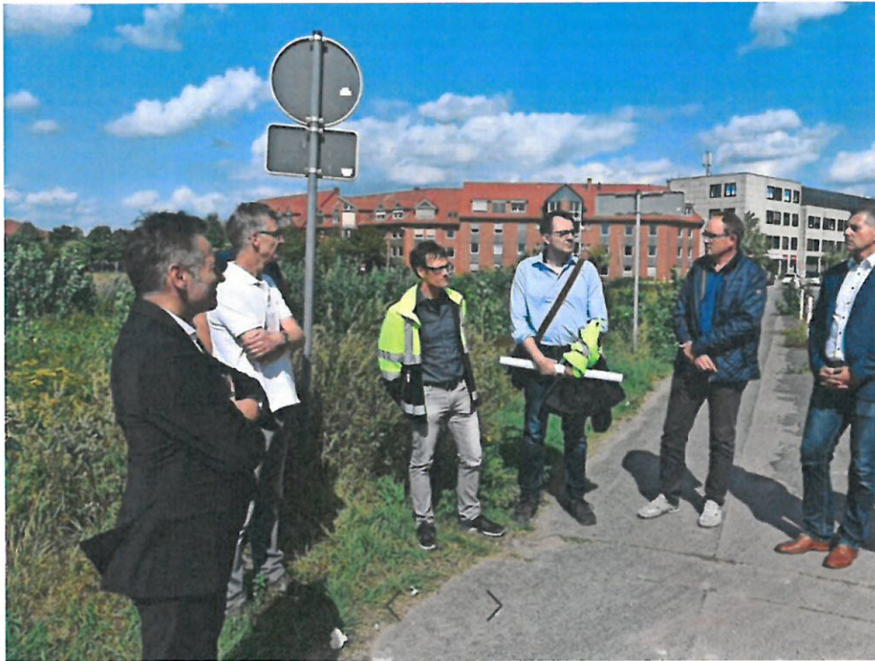
Mitglieder der Stadtverwaltung besuchen die Baustelle am Rathausplatz.