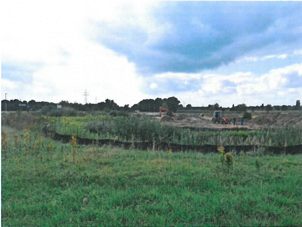
Die Erschließung für die neue Wohnbebauung an der Europaallee hat begonnen.