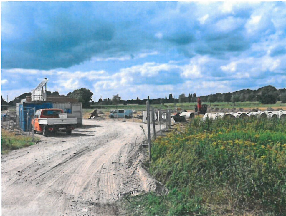
Zwischen Rathausplatz und Europaallee wird eine Baustraße asphaltiert, die auch künftig als Zufahrt zum Quartier genutzt werden soll.