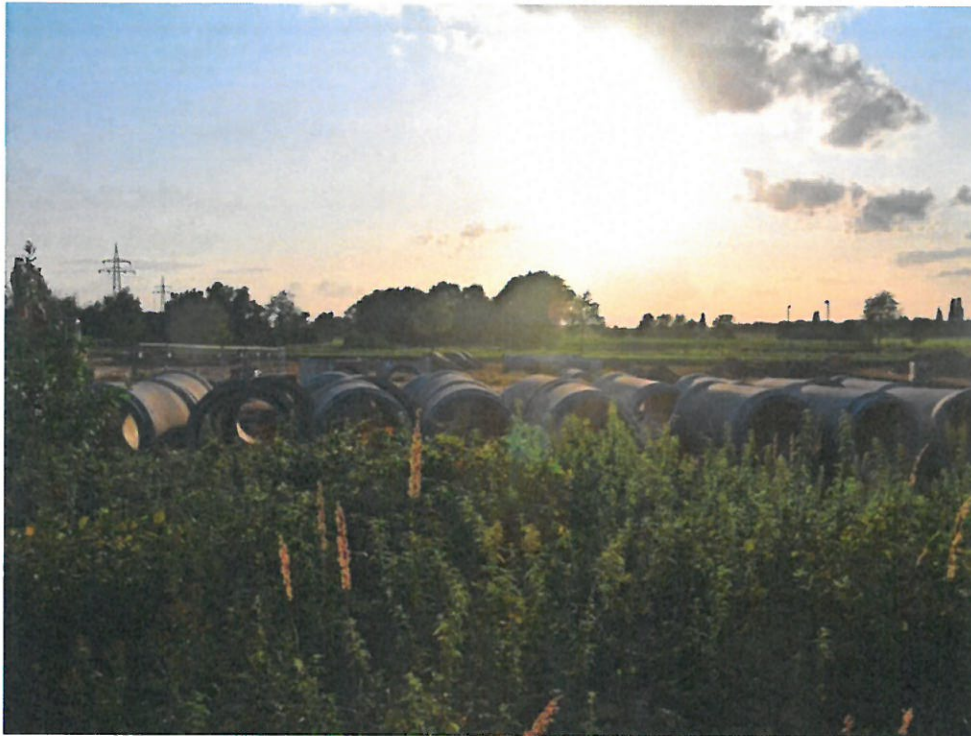
Die Erschließung des neuen Wohnquartiers zwischen Europaallee und Meyenfelder Straße hat begonnen.